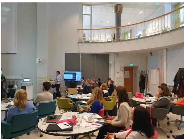
Fig. 1. Activități din cadrul programului de formare.