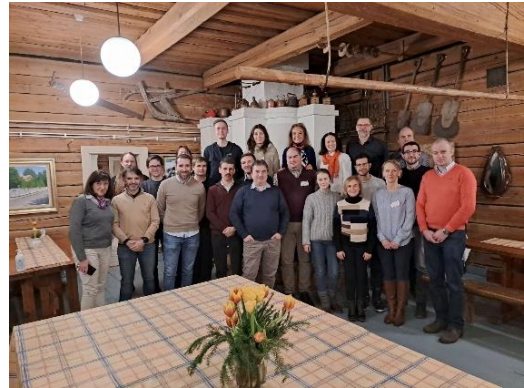
Fig. 3. Fotografii de grup ale partenerilor NextGEng pe parcursul programului de training.

Programul de formare a promovat și extins cunoștințele participanților asupra învățării și a pedagogiilor centrate pe student. Mai mult, activitățile din program au avut în vedere identificarea unor soluții pragmatice care să faciliteze predarea în echipă (team-teaching). Pe parcursul acestor două zile, cadrele didactice participante au avut posibilitatea să discute, să-și împărtășească gândurile și să planifice următorii pași. Activitățile din programul de formare va permite partenerilor să își continue munca valoroasă în acest proiect.