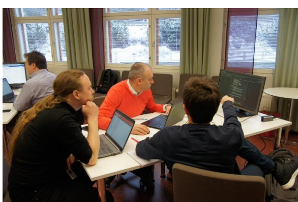
Fig. 2. Workshops – echipele de co-teaching în ziua a doua a programului de training.